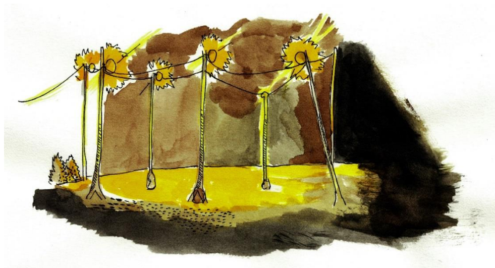
Figura 1 – Desenho a partir do filme Iluminai os terreiros (2006)