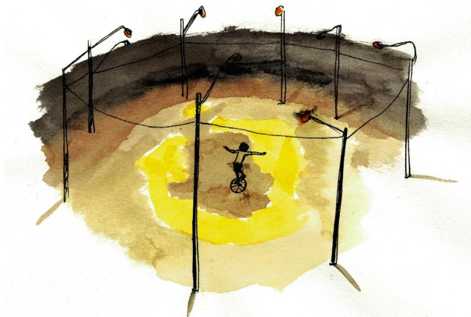
Figura 2 - Desenho a partir do filme Iluminai os terreiros (2006)

Outras vezes, contudo, a solidão da experiência é rompida quando as luzes insólitas chamam a atenção dos moradores locais que se aproximam, posam para a câmera, começam a dançar ou até mesmo a recitar um poema. Debaixo da luz, um homem está posto ao lado de seu filho, montando um cavalo. Eles se insinuam para a câmera, estáticos. Em um outro plano, um filho e sua mãe posam igualmente em frente aos refletores, em silêncio. Outro dia, outro lugar abandonado. Dois homens se aproximam da obra. Um está em frente à câmera dançando e recitando incansavelmente os versos de um poema, enquanto o outro percorre o caminho circular desenhado pela luz no chão. Depois de um tempo, os dois comparsas invertem os papéis. O segundo passa a recitar um poema de amor, enquanto o primeiro, no fundo do quadro, circula pelo espaço iluminado em cima de um monociclo.