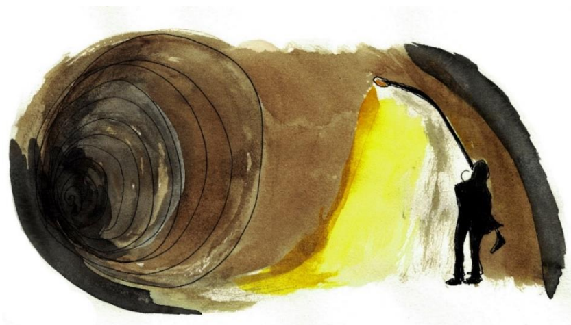
Figura 3 - Desenho a partir do filme Iluminai os terreiros (2006)

havia estabelecido durante a primeira parte, desmoronam-se. A cena apresenta a entrada de um túnel abandonado, diante do qual se encontra uma única luz atada na base de um poste. Um homem se aproxima, desamarra a haste de aço que sustenta a luz, e se lança em uma missão quixotesca de levar essa luz até a saída do túnel. Há uma grande solenidade no ar. Ele avança, em silêncio, pelas profundezas desse túnel de 454 metros de terra e d'água; ofega, geme e se curva debaixo do peso dessa tocha gigante que carrega. O esforço e o cansaço estão manifestadamente legíveis no seu rosto. Ele para, recupera seu fôlego, e continua sua absurda tarefa.